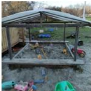
Redskabsbillede > Del-1 Redskab