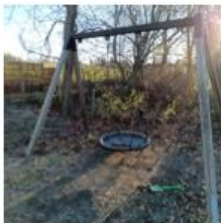
Redskabsbillede > Gynger